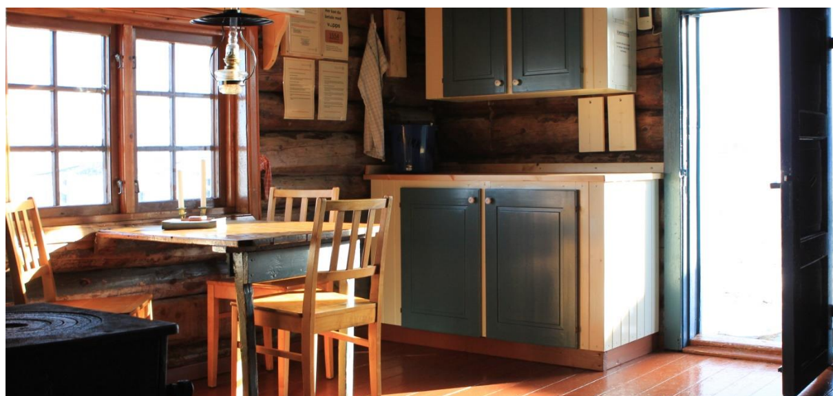
Nordbua 29. mars 2019

De åpne buene er mye brukt og et stort pluss for vestfjellet og Langsua Nasjonalpark, men de er også en stor utgiftspost for fjellstyret. Utleieinntektene fra småviltjakta bidrar litt til å opprettholde tilbudet om åpne buer for allmenheten resten av året.