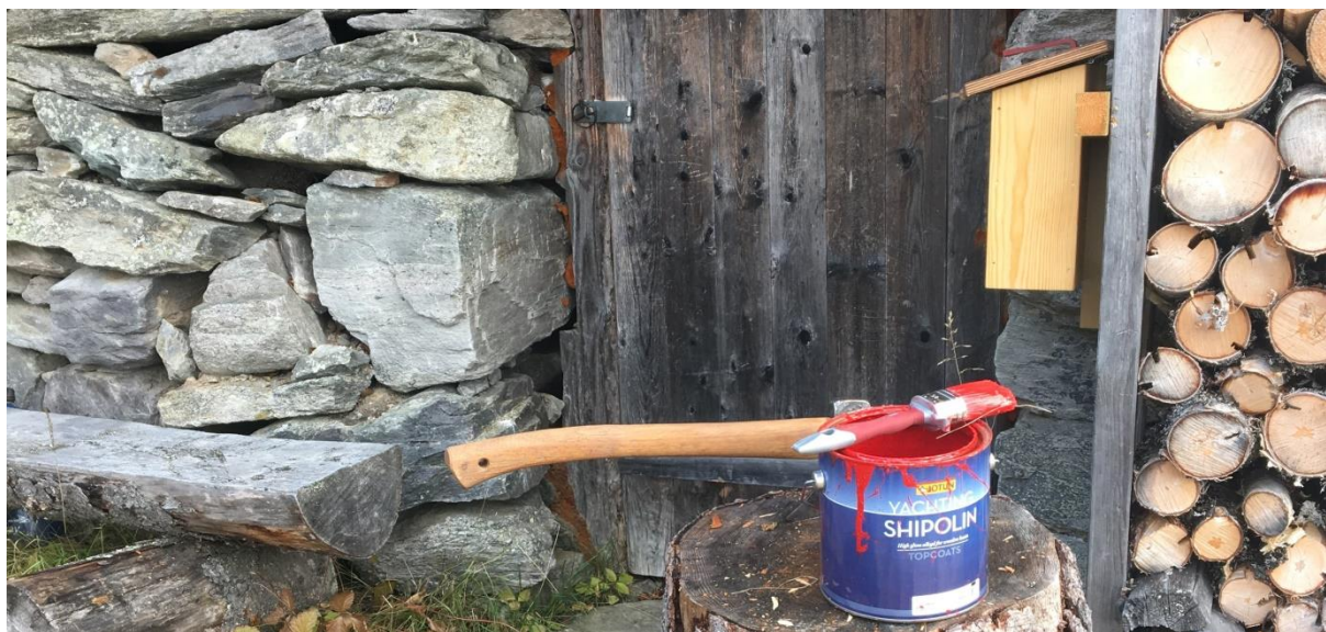
Remerking av stien til Røverhula, 12. oktober 2019

Det er også gjort en del vedlikehold og utskifting av skilt.