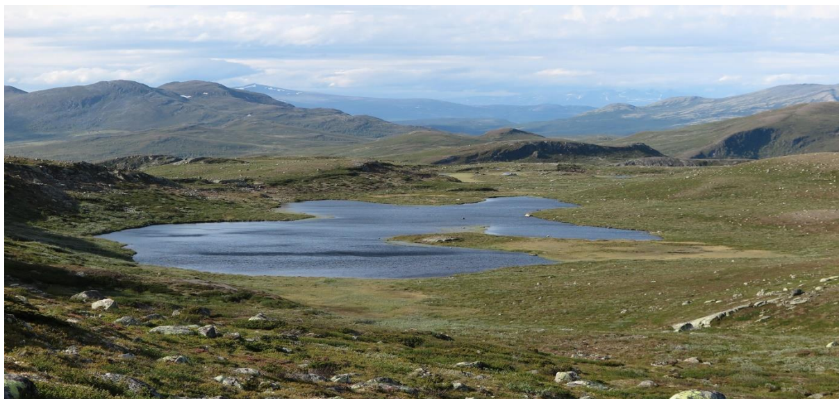
Raudgrovtjønnen 29. juni 2019

Det ble brukt 913 arbeidstimer på oppsyn i 2019. Totalt brukte fjellstyrets ansatte 4983 arbeidstimer fordelt på oppsyn, skjøtsel/vedlikehold, saksbehandling/administrasjon og tjenestesalg (Langsua nasjonalparkstyre, SNO, DNT, Liumsetervegen SA og Torpa fjellstyre).