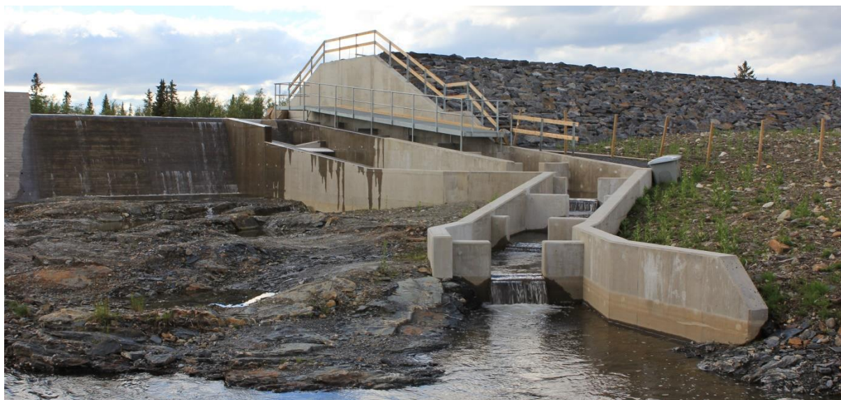
Nybygd fisketrapp i forbindelse med Eidsiva energi sin renovering av Hornsjødemningen, 17. juni 2019.

Årlig blir det gjennomført fiskeundersøkelser og prøvefiske. I 2019 ble det prøvefisket i Dokkvatnet (nordre del), Tortjønnet og Vågskardsvatnet. På Tortjønnet fikk fjellstyret god prøvefiskehjelp av flinke elever fra Dokka videregående. Resultater fra prøvefiske som egen rapport på www.gausdal-fjellstyre.no .