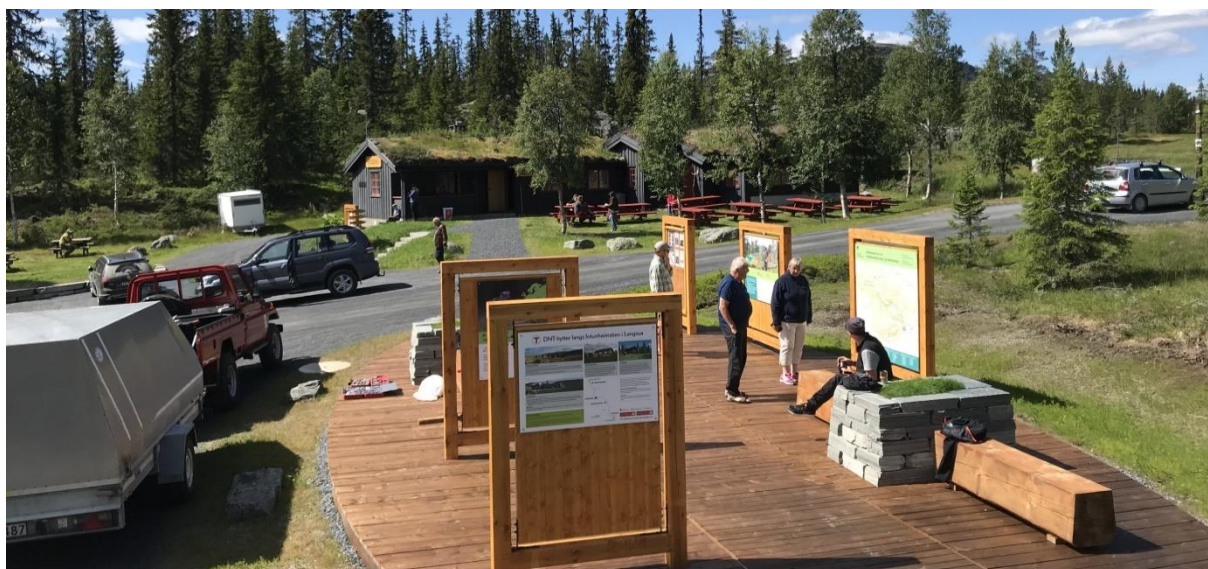
Infopunkt Holsbru, 16. juli 2019. Fjellstyret har ei infotavle, DNT har ei infotavle og Langsua nasjonalparkstyre tre infotavler.

Det praktiske arbeidet er utført av Erik Sveen AS (graving, planering og natursteinsmuring med gravemaskin) og fjellstyrets ansatte (snekring, natursteinsmuring for hånd, mm.)