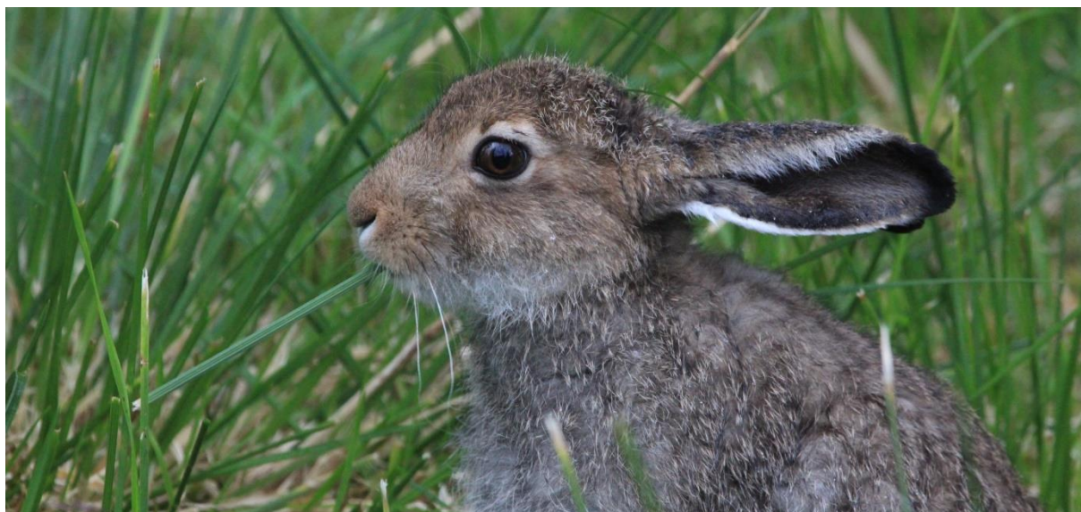
Hare på Kittilbu, 20. august 2019

Øvrig småviltjakt går som normalt iht. driftsplan og gjeldende jaktregler.