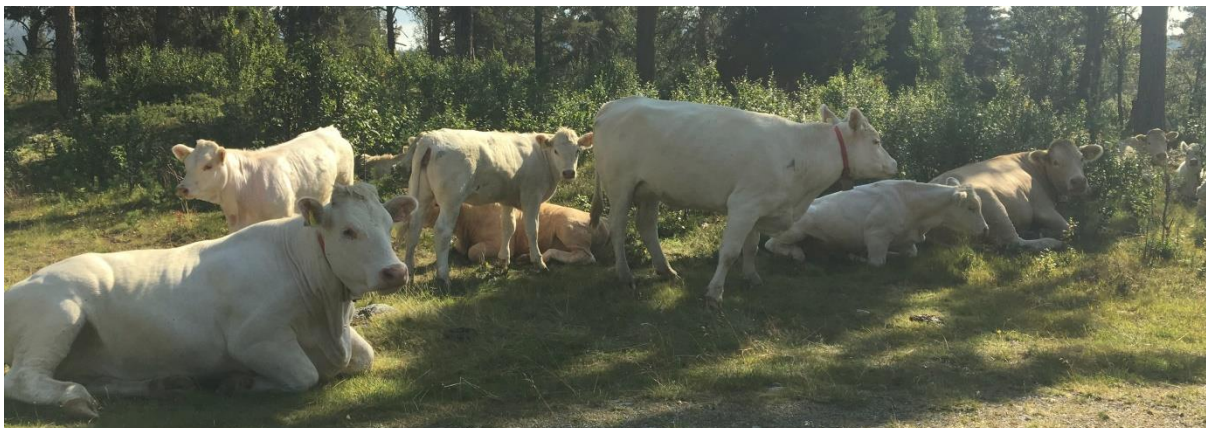
Storfe i Dokkfaret 27. august 2019