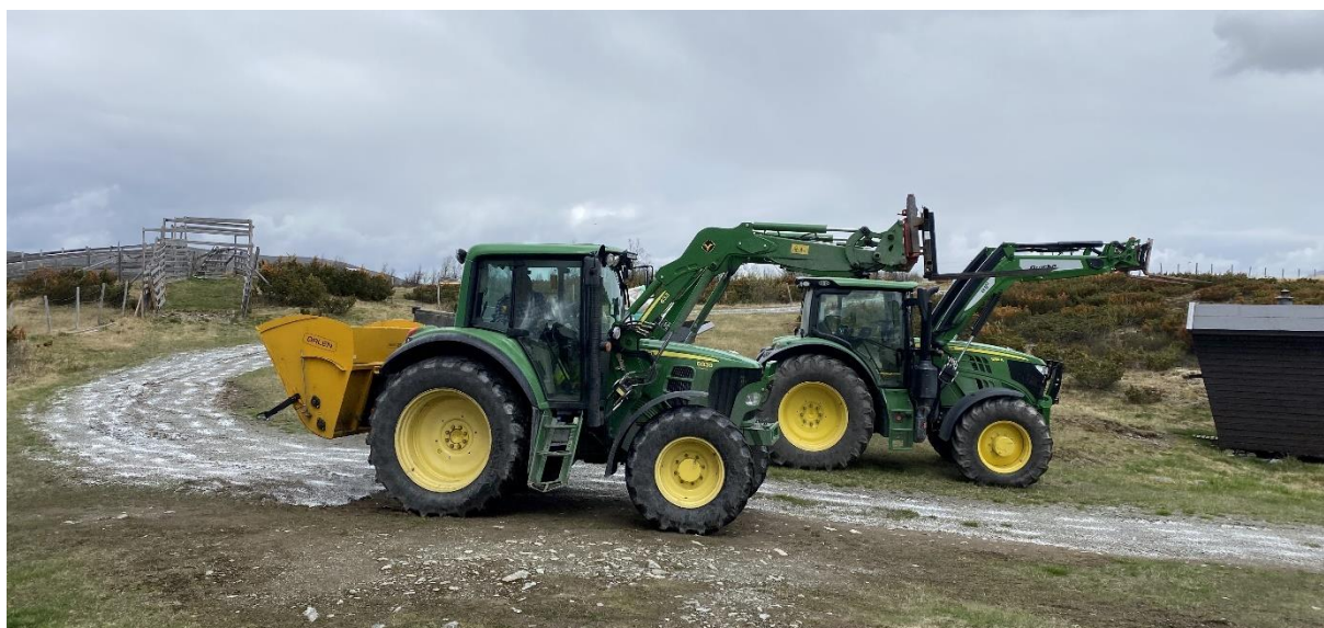
Gausdal Bilselskap AS klargjør Revsjøvegen, 9. juni 2022

Ellers har det blitt gjennomført normalt veivedlikehold med grusing, slådding, salting og kantslått.