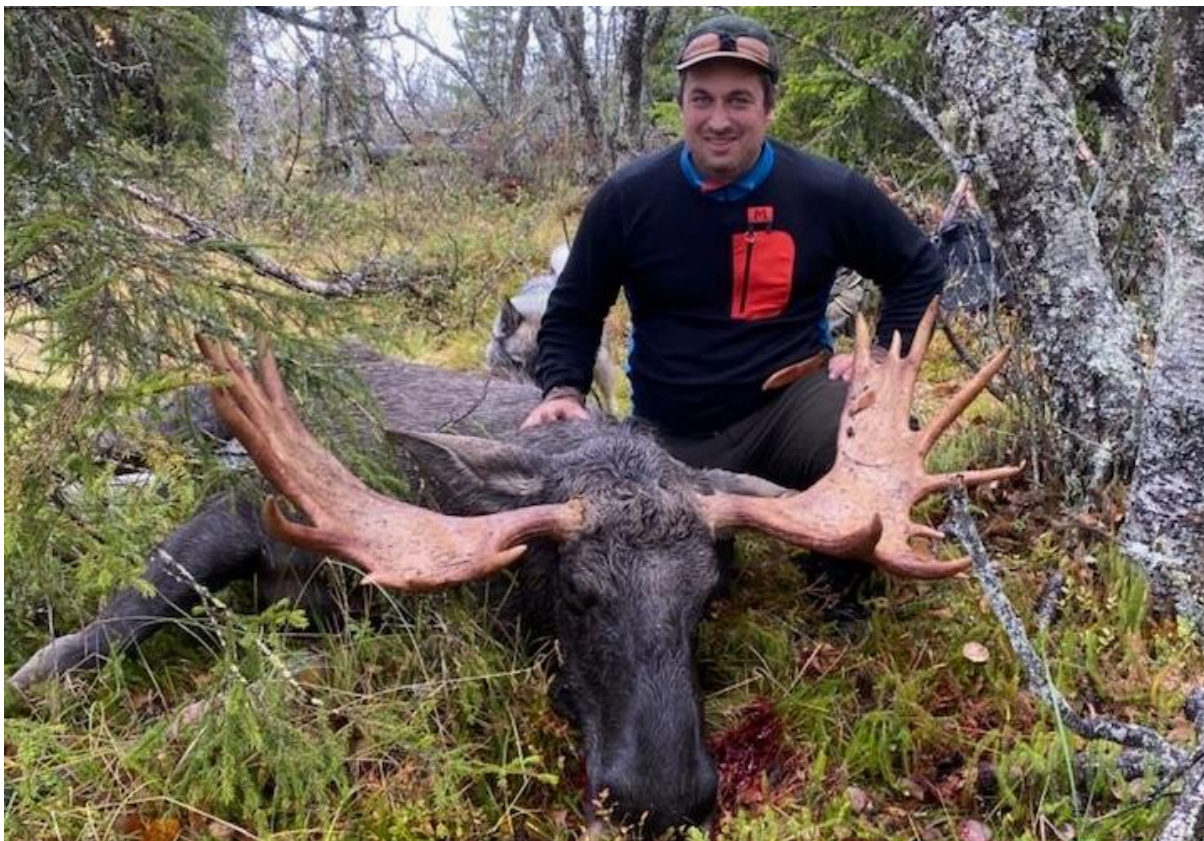
17-tagers okse, Mossjøen jaktfelt, 2. oktober 2022