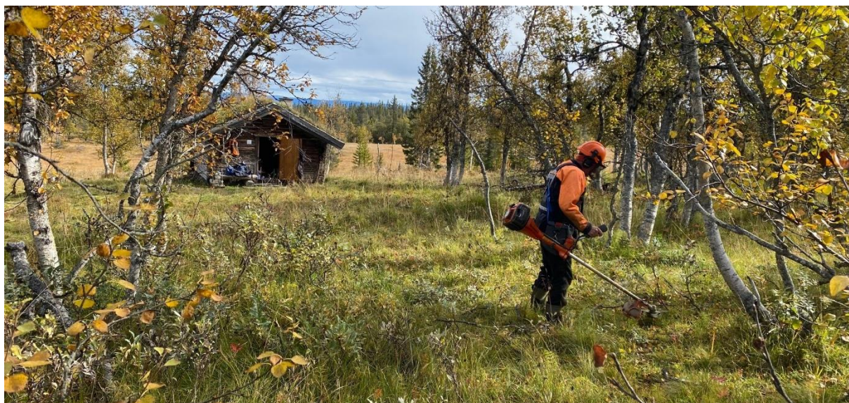
Grasslått ved Moslettbua, 26. september 2022.

Liumsetervegen SA kjøper tjenester av fjellstyret på drift av bommen ved Holsbru og div. vedlikeholdsoppgaver på Liumsetervegen (71 arbeidstimer)