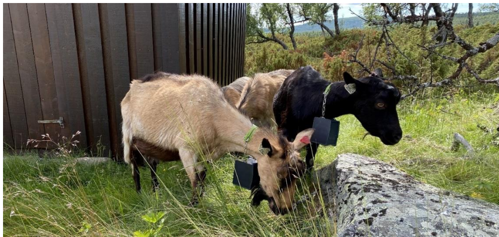
Ryddegeiter ( www.ryddegeita.no ) i aksjon på Liumsetra, 22. juli 2022

I tillegg beitet det 40 geiter og kje i området rundt Liumseter.