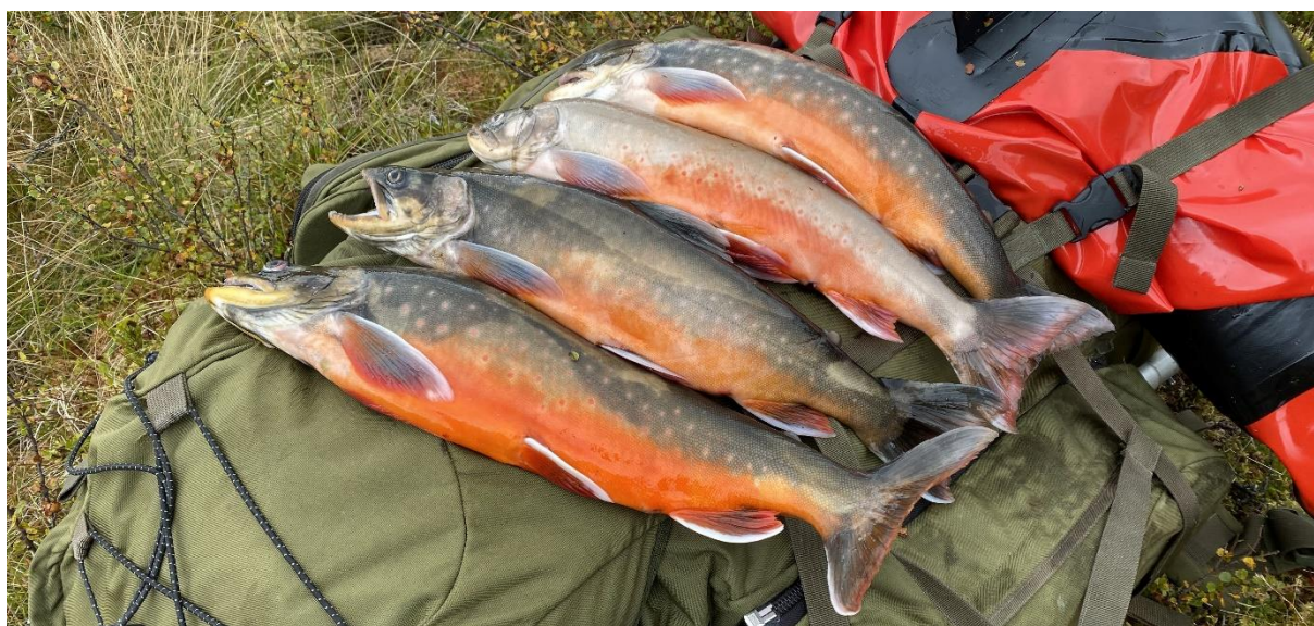
Røyefangst fra Kroktjønnnet på Vetafjellet, 8. september 2022

I 2022 ble det prøvefisket i Kroktjønnnet på Vetafjellet, Febutjønnnet og Ormtjønnnet. Resultater fra prøvefiske som egen rapport på www.gausdal-fjellstyre.no