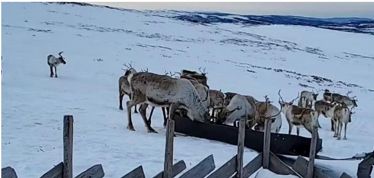
Tamrein ved Vesterheimsbua, 7. april 2022

Fram tamreinlag leier vinterbeite av fjellstyret. Nåværende avtale ble inngått i 2014, og er en videreføring av tidligere avtaler. Samlet beitetrykk må ikke overstige det som tilsvarer 2000 dyr på beite gjennom hele vinteren. Fram reinlag plikter å tilpasse dyretallet til beitegrunnet slik at overbeiting unngås.