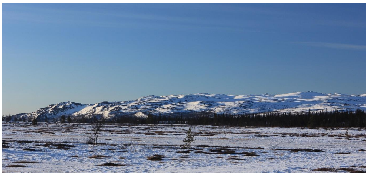
Beskjedne snømengder på Oppsjømyra 2. april 2022

Informasjon og salg via www.inatur.no er også en viktig informasjonskanal. I tillegg driver Norges fjellstyresamband aktiv markedsføring av fjellstyrenes tilbud via egne nettsider, www.fjellstyrene.no , og facebook, www.facebook.com/fjellstyrene . Denne samlede markedsføringen er svært viktig for fjellstyrene.